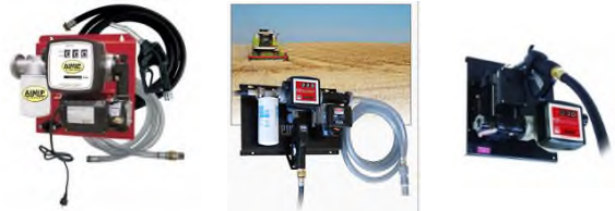
Voir descriptif pompes page 4