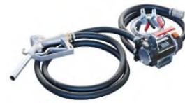
Voir descriptif pompes page 14