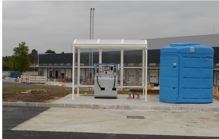
Exemples de réalisations avec habillage en verre