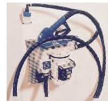
Voir descriptif pompes page 15

Idéal pour le stockage de FUEL, GASOIL ou GNR ou ADBLUE, dans des endroits où la place est limitée, car la citerne est compacte.